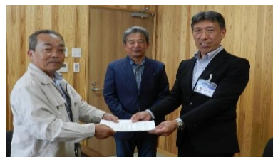
新宮市・新谷企画政策部長 松本市議会議員同席