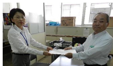
田辺市・福田自治振興課長